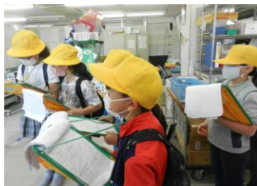
【2年生 生活科】 町探検 お店の方の話を聞いてメモ