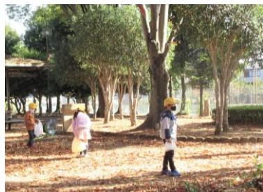
【1年生 生活科】 秋をさがしに丸林中央公園へ

秋は校外学習たけなわ。各学年とも関係機関や保護者ボランティアのご協力の下、様々な体験活動や実際の見聞によって、各教科の座学だけでは得られない学びを深めています。