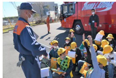
【3年生 社会科】 小山消防署、警察署 手を挙げて質問!